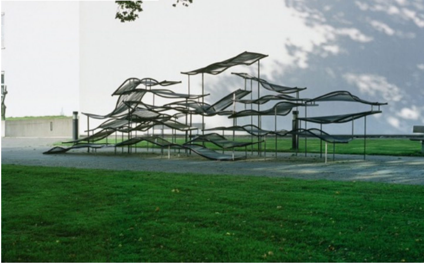
222张床，罗斯加德工作室

22张床，2002，荷兰恩斯赫德市。床的螺旋、钢铁、颜料；1100x50x300厘米（长x宽x高）。雕塑带有22张床垫的螺旋丝，创造出了一副沉睡、做梦和做爱时动态风景线。